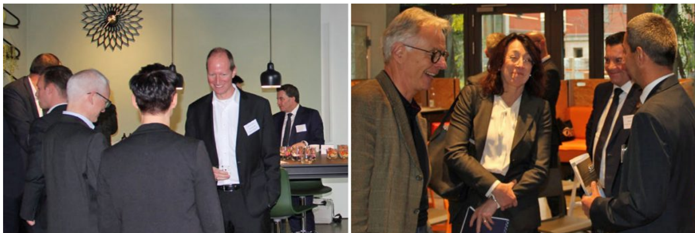
Austausch im Vitra Showroom

begründete die Fokussierung mit dem Potential des Nasdaq 100, der die 100 größten Nasdaq-Unternehmen umfasst, die nicht zum Finanzsektor zählen. Er enthalte global agierende, höchst innovative Unternehmen – weit mehr als die allgemeine Konzentration auf große, hoch bewertete Titel wie Facebook, Amazon und Apple nahelegt.